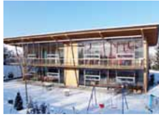
Ideal bei flach geneigten Dächern