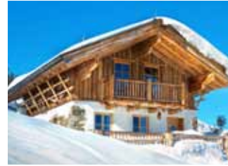
Ideal in schneereichen Gebieten

STEICOsafe lässt sich wie eine gängige Unterdeckplatte handhaben. Die überlappende Unterdeckbahn bietet je nach Art der Verklebung zusätzlichen Schutz der Konstruktion.