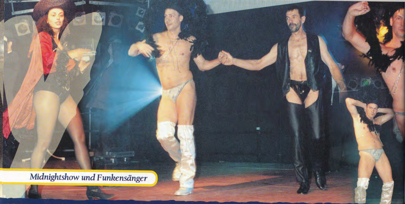
Midnightshow und Funkensänger