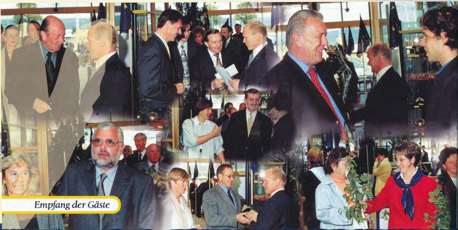
Empfang der Gäste